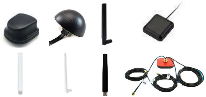
蜂窝 LTE 天线 LoRa 天线 GPS 天线