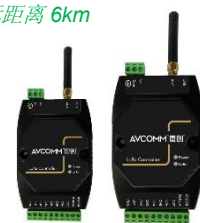
AP100 LoRa MAC 网关