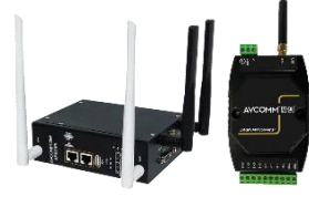
AP300 LoRa 网关和 AP100 LoRa WAN 网关